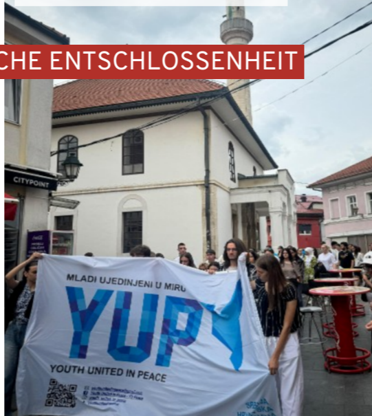
Politisch handeln: Teilnehmende organisieren eine Gedenkaktion für Kriegsoffer in Tuzla beim Aktivencamp 2025.

Das YU-Peace-Netzwerk ist organisch über 30 Jahre gewachsen. Die meisten Partnerstädte sind über persönliche Kontakte dazugekommen, andere aufgrund aktiver Vernetzungsarbeit vor Ort.