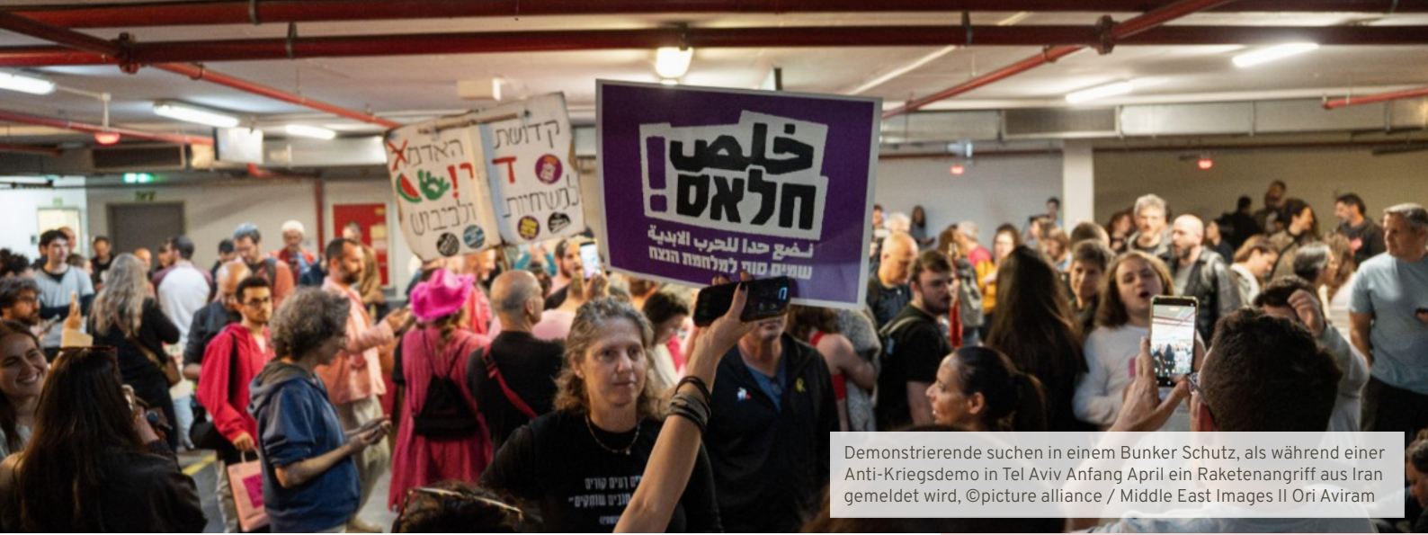
Demonstrierende suchen in einem Bunker Schutz, als während einer Anti-Kriegsdemo in Tel Aviv Anfang April ein Raketenangriff aus Iran gemeldet wird.

tigt – fast wöchentlich treffen sich die binationalen Teams online, sprechen über Ereignisse der letzten Tage und geben einander Halt.